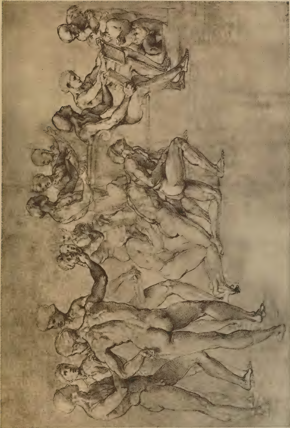
Etude pour la Dispute du Saint-Sacrement (Groupe à gauche de l'autel)